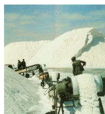
Förderbandantrieb (Salzgewinnung )