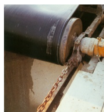
Trommelmotor mit Rücklaufsperr (Sandförderer )