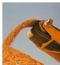
Förderbandantrieb (Kieswerk )